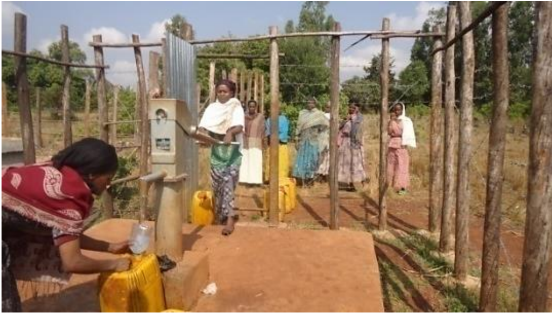
Dans un village de l'Oromia, les femmes attendent de puiser 'leur' eau à une borne installée par OSRA