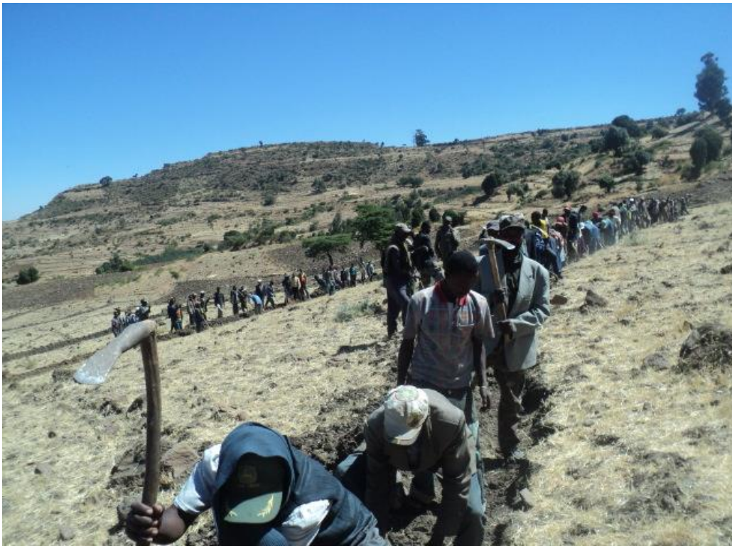
Travail communautaire pour pallier l'érosion des sols en creusant des tranchées de rétention d'eau