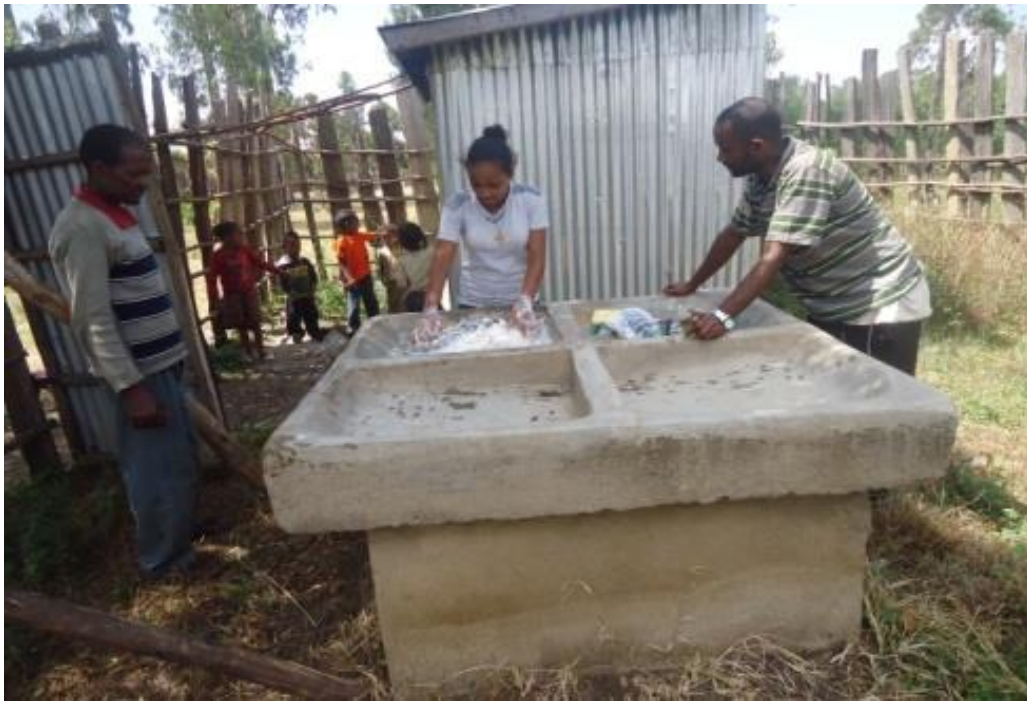
Quatre bacs-lavoirs sont installés près de chaque borne hydrique à coté des cabines de douches

Ce qui est plus parlant en termes de l'impact que peut avoir l'activité d'OSRA en Ethiopie, c'est de déterminer le nombre de personnes qui ont profité là-bas de l'action d'OSRA, qui n'a pu être poursuivie que grâce aux institutions et aux personnes qui les soutiennent ici . En 2023, voici ce qui a été réalisé :